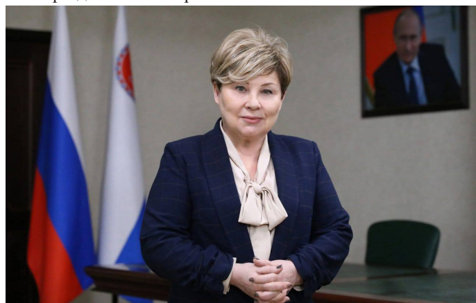
Председатель Законодательного Собрания Камчатского края И.Л. Унтилова