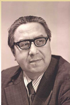
Поротов Георгий Германович

3 мая 2024 года исполнилось бы 95 лет ительменскому писателю, поэту, музыканту, фольклористу, члену Союза писателей СССР - Георгию Германовичу Поротову.